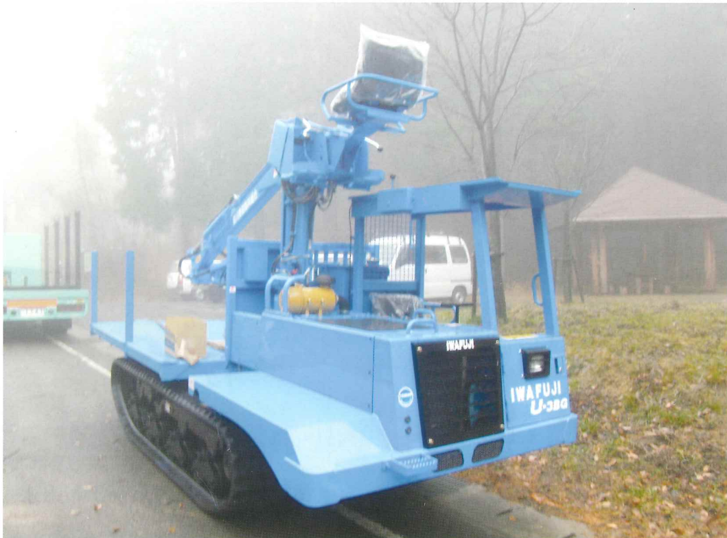
平成21年12月に導入した高性能林業機械(フォワーダー)

最後になりましたが、本年度は本組合が合併して10年目の節目の年となります。この節目の年を機会に、合併や組合活動にご協力、ご支援を頂きました組合員、関係者の皆様に改めて感謝の気持ちを表すとともに、今後も組合員の皆様に貢献できる組合作りをめざし、飛躍することを新たに認識するために、記念式典を平成22年10月16日(土)午後1時30分から三木町文化交流プラザで開催いたします。組合員の皆様の多数ご参加をお願い申し上げますとともに、皆様方の益々のご健勝をお祈り申し上げご挨拶いたします。