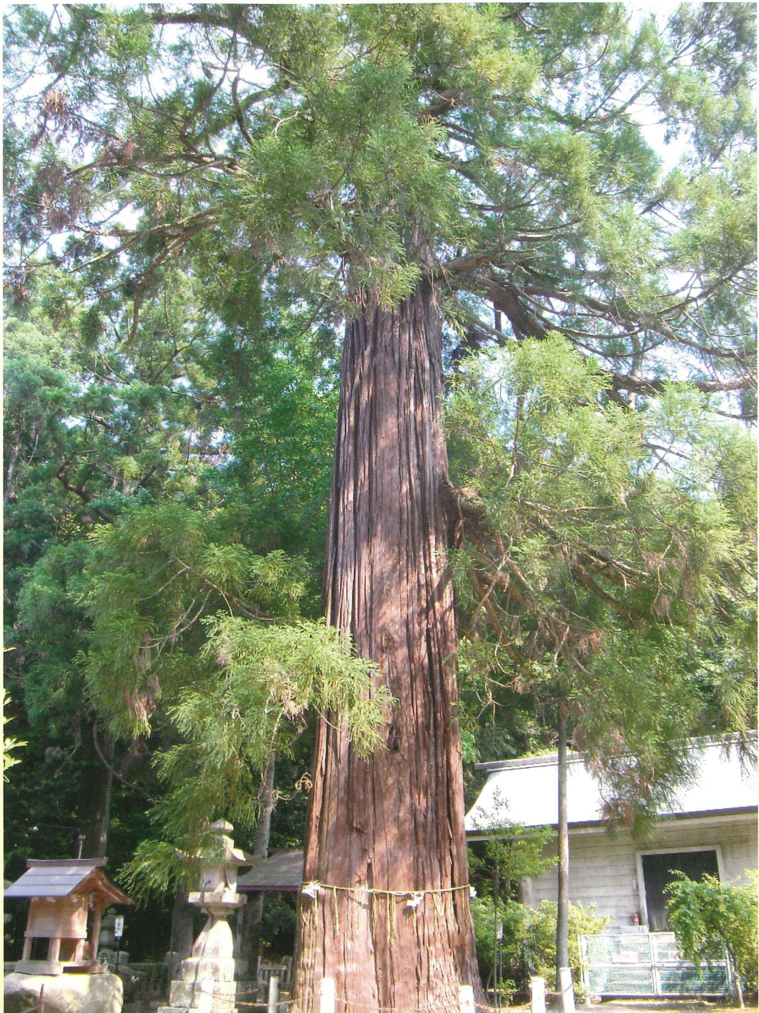
水主神社のいのり杉(東かがわ市水主)