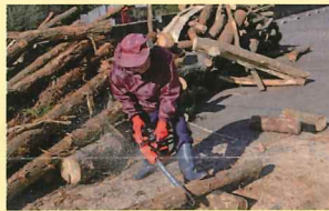
▲まず間伐材を50cm~60cm に切断します。