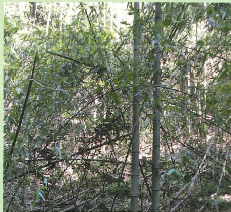
人が手を入れない放置竹林