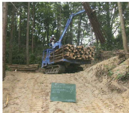
高性能林業機械を使用した作業路の作成、搬出間伐作業