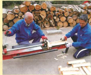
▲薪割り機で薪を割り作成し ます。