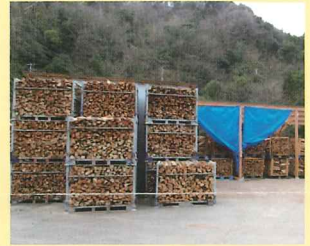
▲薪をパレットに積み乾燥