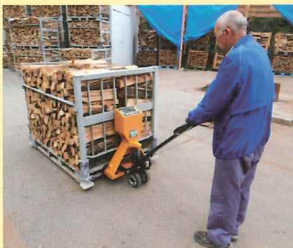
▲薪を計量し、フォークリフトでボイラーまで搬送 1パレット500kg(パレットの重さ含む)このパレットで夏場 であれば1日分、冬場は2パレット必要。