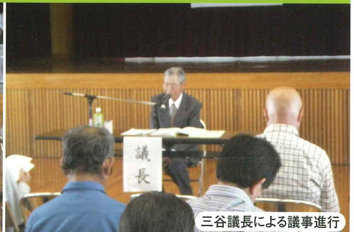
三谷議長による議事進行