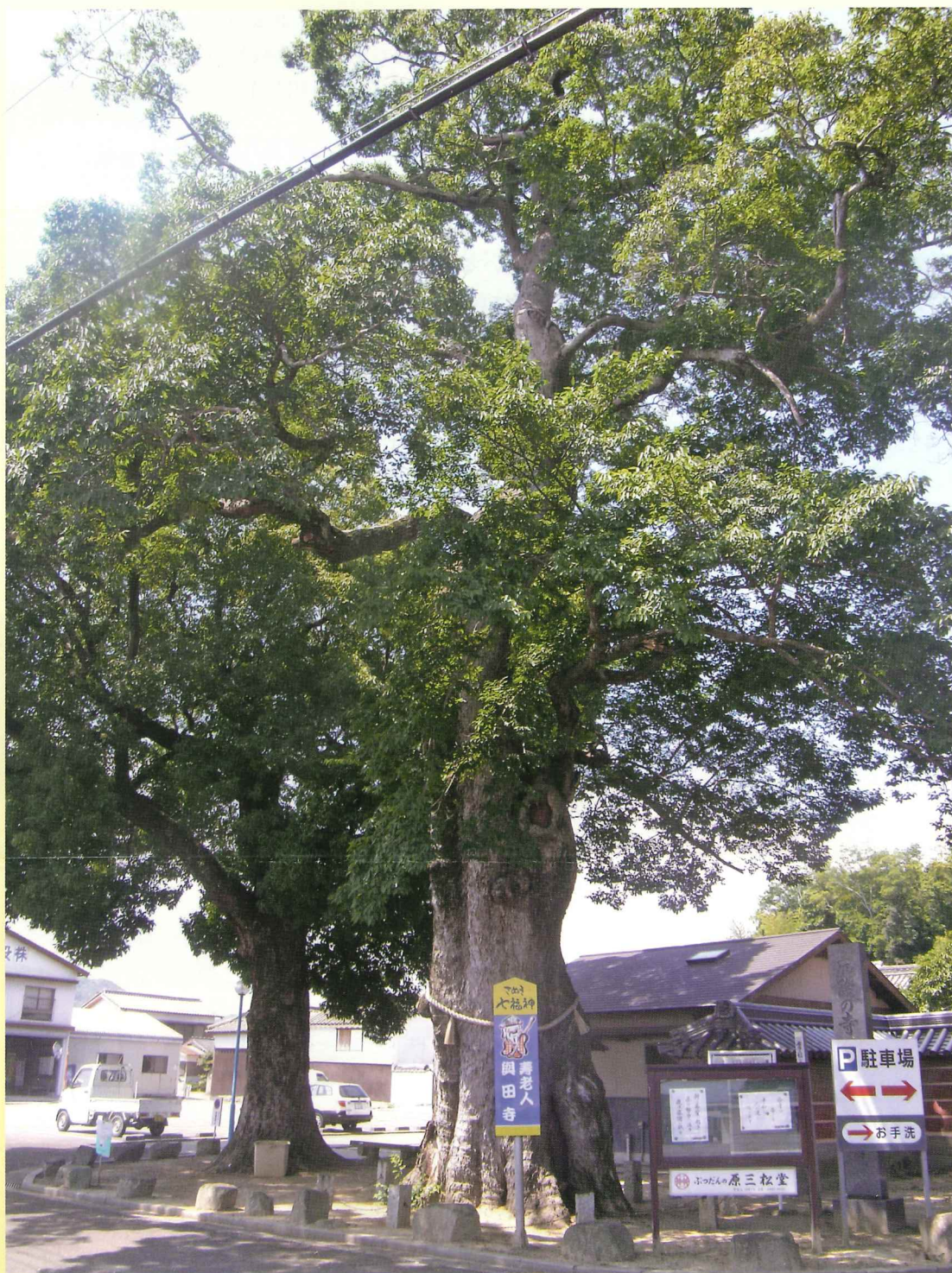
與田寺のムクの木(県指定天然記念物)