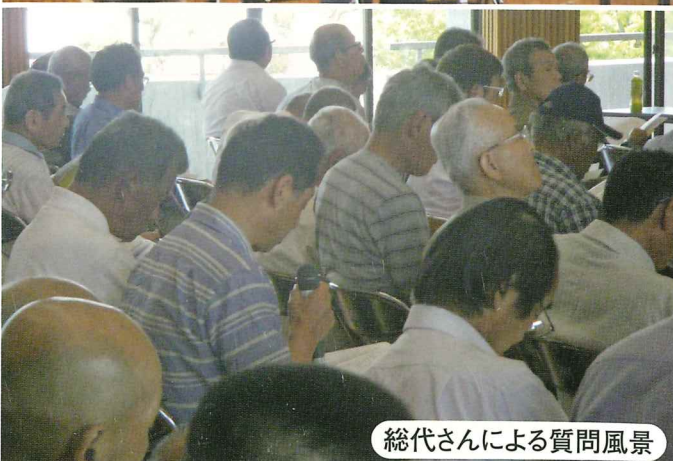
総代さんによる質問風景