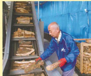
▲薪を投入 ここに投入し時間と温度を設定しておけば自動でボイラー に投入され温度を一定に保ってくれます。