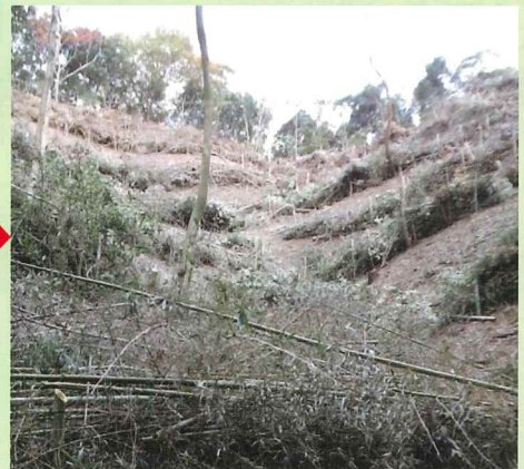
竹伐採後、ヒノキを植栽した竹林