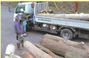
▲間伐材の仕入れ 当組合も納入しています。