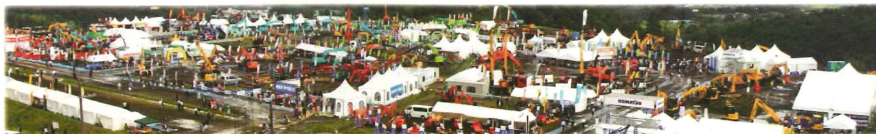
展示実演会の様子(平成28年京都府の例)