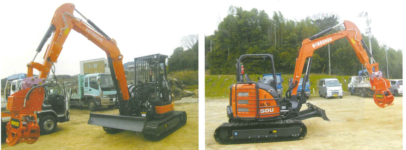
平成29年3月に導入したグラップル、ウインチ付バックホー