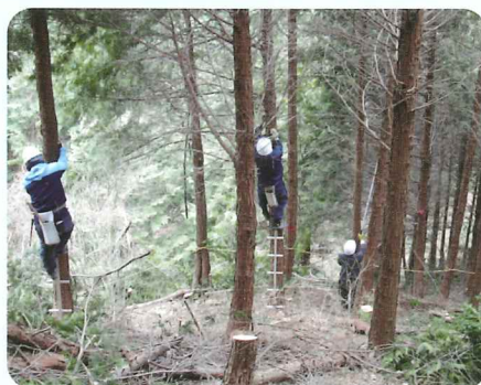
会員によるヒノキの間伐及び枝打作業