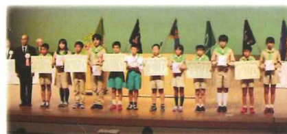
大会の様子(平成28年京都府の例)