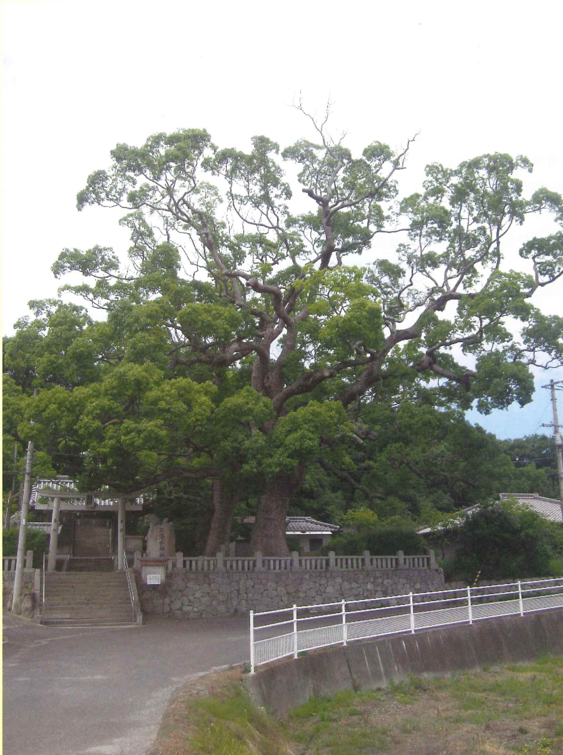
石清水神社のクスノキ 香川の保存木(東かがわ市)