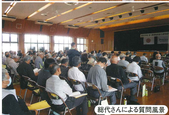
総代さんによる質問風景