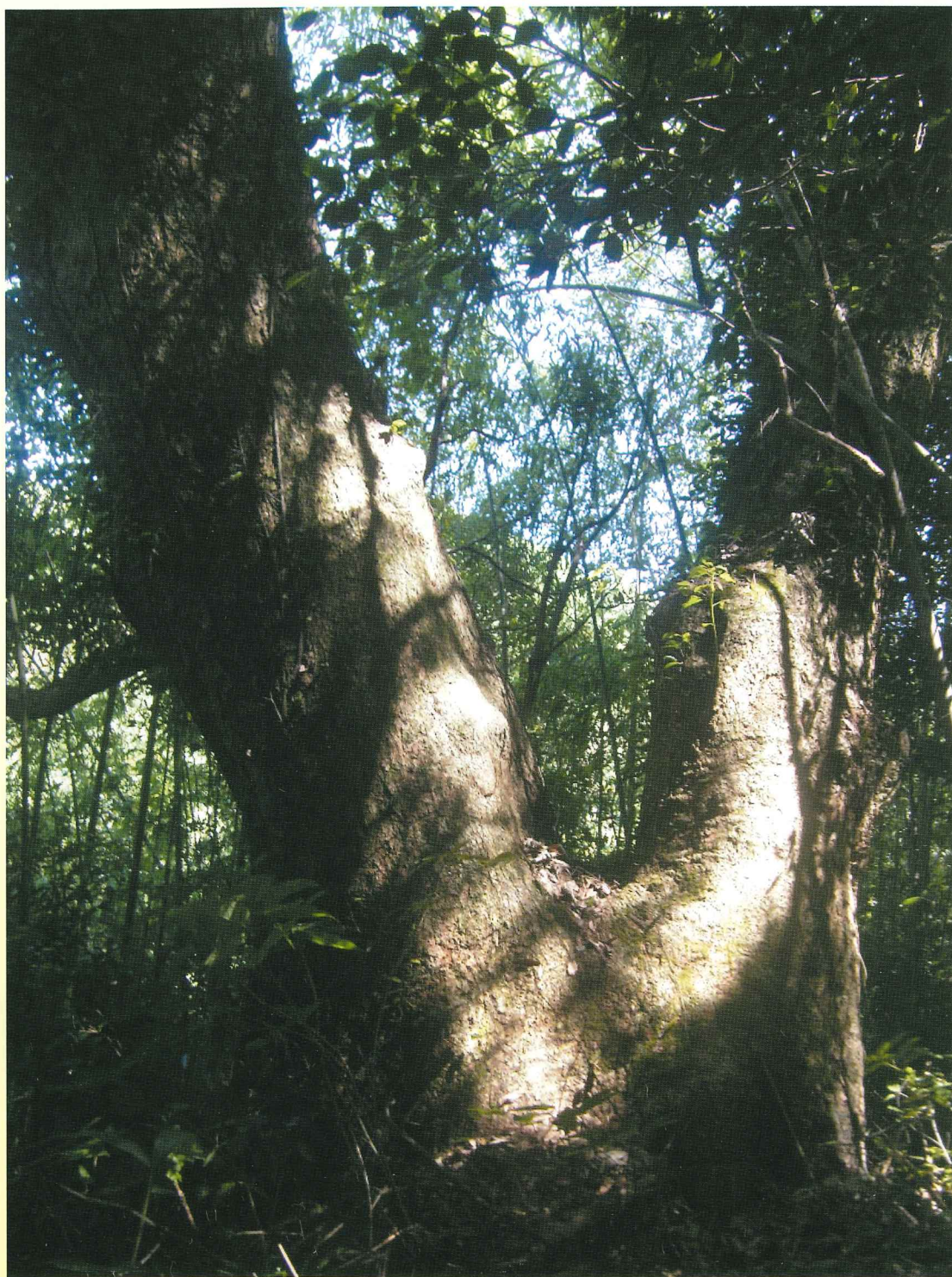
楠神社のクスノキ 高松市西植田町(香川の保存木)