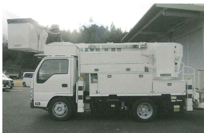
令和5年度に導入した3tクレーン付きトラックと高所作業車