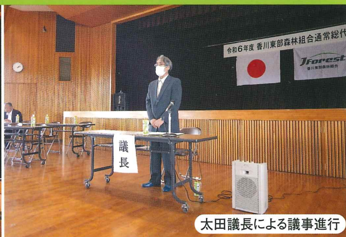
太田議長による議事進行