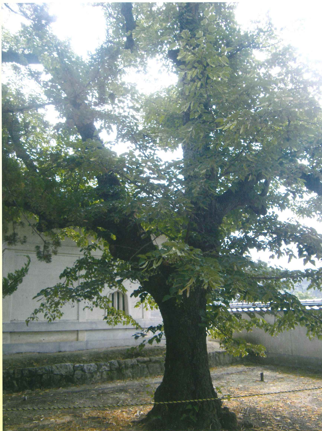
三宝寺のボダイジュ(県指定天然記念物)