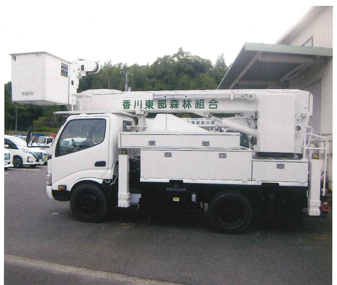
令和6年度に導入した高所作業車